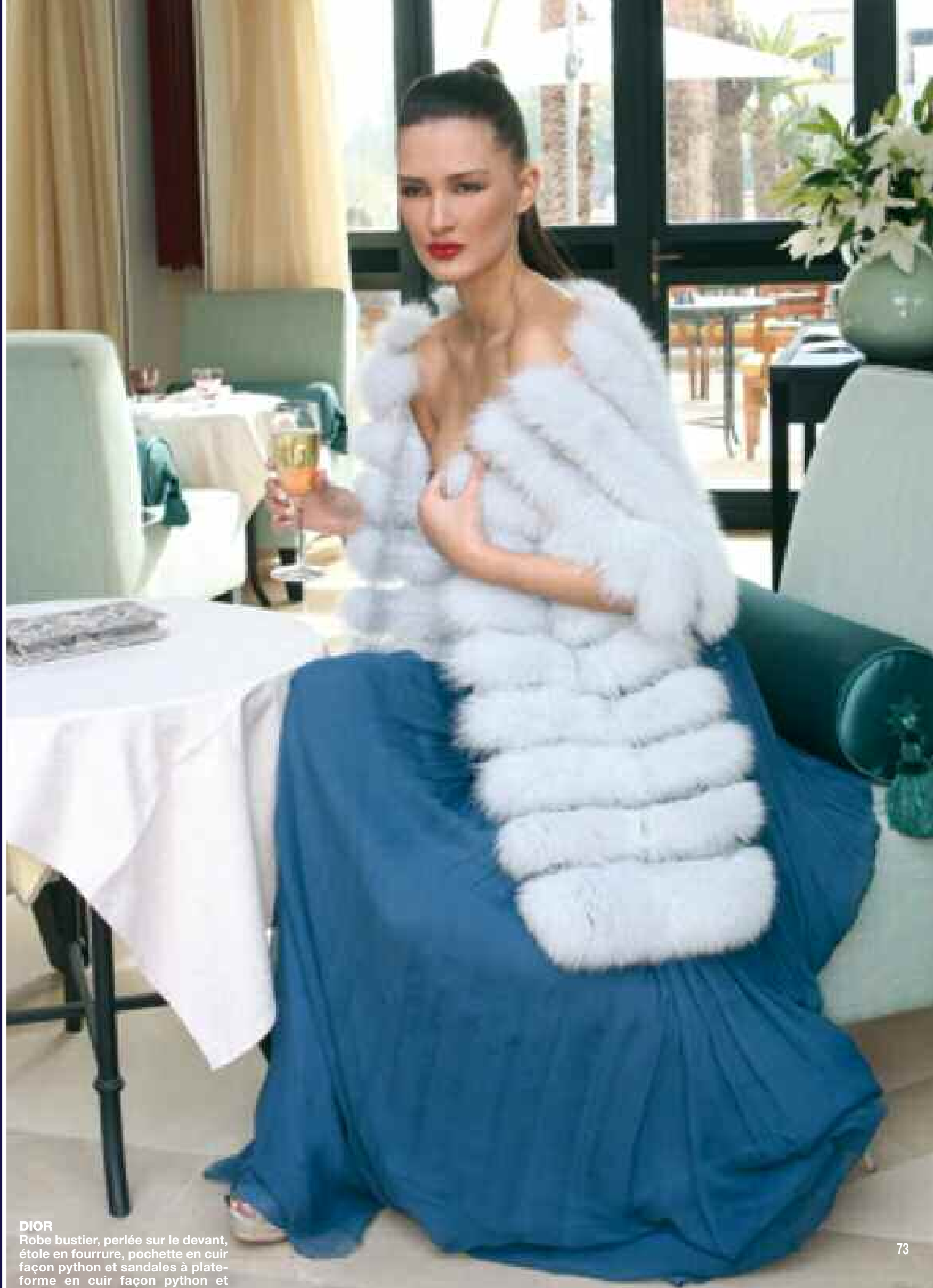
DIOR Robe bustier, perlée sur le devant, étole en fourrure, pochette en cuir façon python et sandales à plate- forme en cuir façon python et agneau brillant or